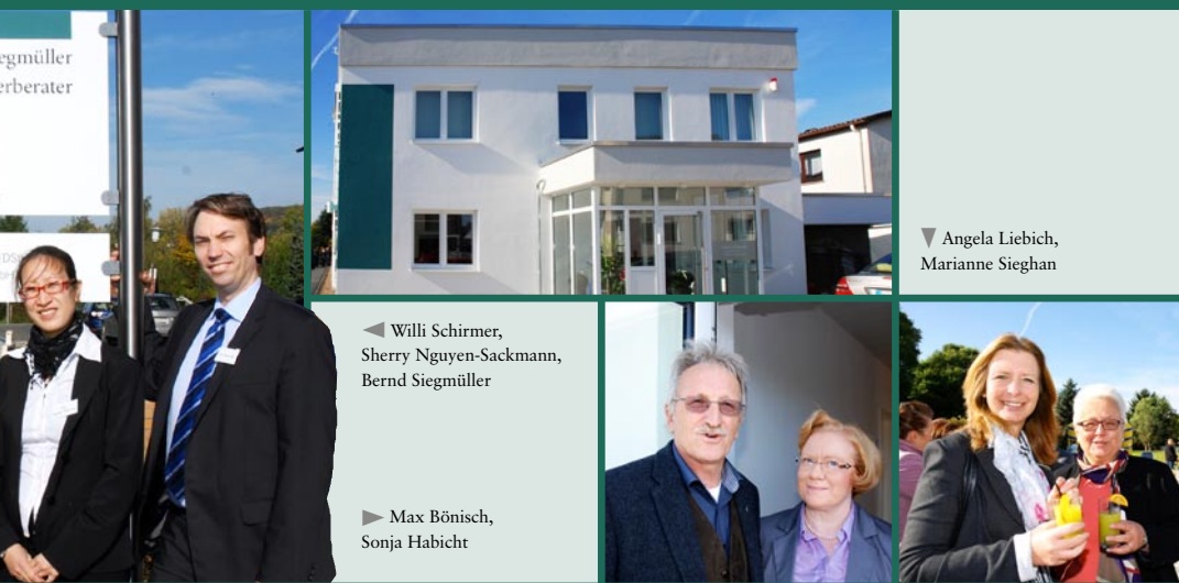
Schirmer & Siegmüller Steuerberater

Da das 26-köpfige Team mit vielen Teilzeitkräften besetzt ist, war der Neubau aus Platzgründen nötig geworden. Um allen Mitarbeitern eine gute Möglichkeit der Vereinbarkeit von Familie und Beruf zu bieten, laufen derzeit Gespräche mit dem Landkreis Northeim zu einem weiteren Projekt. „Wir haben noch viel Platz auf dem Gelände“, lächelt Herr Siegmüller geheimnisvoll. ■